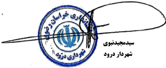
سیدمجید نبوی شهردار درود

۱۷- شرکت کنندگان می توانند جهت کسب اطلاع بیشتر و بازدید از محل های مزایده و سایر شرایط موجود در مدت انتشار آگهی به شهرداری مراجعه و کسب اطلاع نمایند. ۱۸- متقاضیان می توانند از تاریخ انتشار نوبت دوم آگهی مزایده بمدت یک هفته جهت دریافت اسناد مزایده به واحد مالی مراجعه نمایند. آخرین مهلت تحویل پاکات به دبیرخانه شهرداری لغایت ساعت ۱۱ روز سه شنبه مورخ ۹۴/۱۲/۲۵ ضمناً پاکات در ساعت ۱۲ همان روز در محل شهرداری درود بازگشایی میگردد.